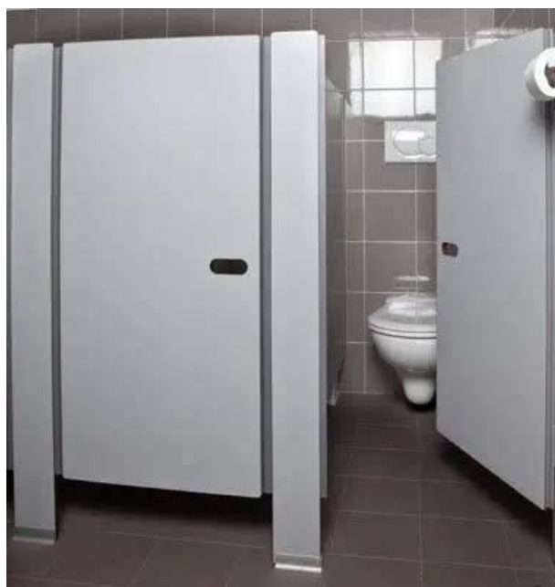
Esemplificazione degli interventi di rinnovamento e sostituzione delle finiture dei Servizi Igienici