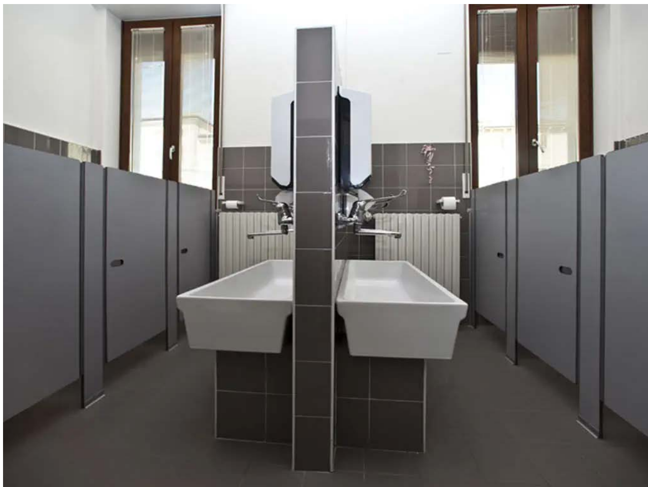
Esemplificazione degli interventi di rinnovamento e sostituzione delle finiture dei Servizi Igienici